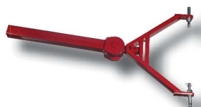
Lanza articulada a los brazos del tractor