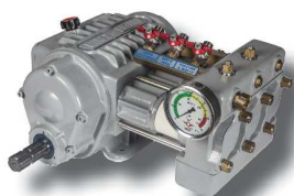
Bomba super reductora ML-A1 (Equipamiento de serie)