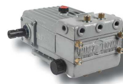
Bomba especial directa ML-D